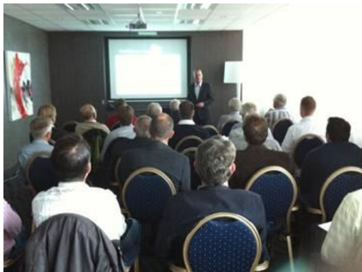
Afbeelding: Seminar 04 september 2010 Van der Valk hotel Amersfoort A1

Sinds 04 december heeft WB een nieuwe huislocatie voor seminars en trainingen. Het betreft het splinternieuwe Van der Valk hotel Amersfoort A1. Dit viersterren hotel heeft een uitstekende centrale ligging (gratis parking) en voor iedereen gemakkelijk te bereiken, ook per openbaar vervoer.