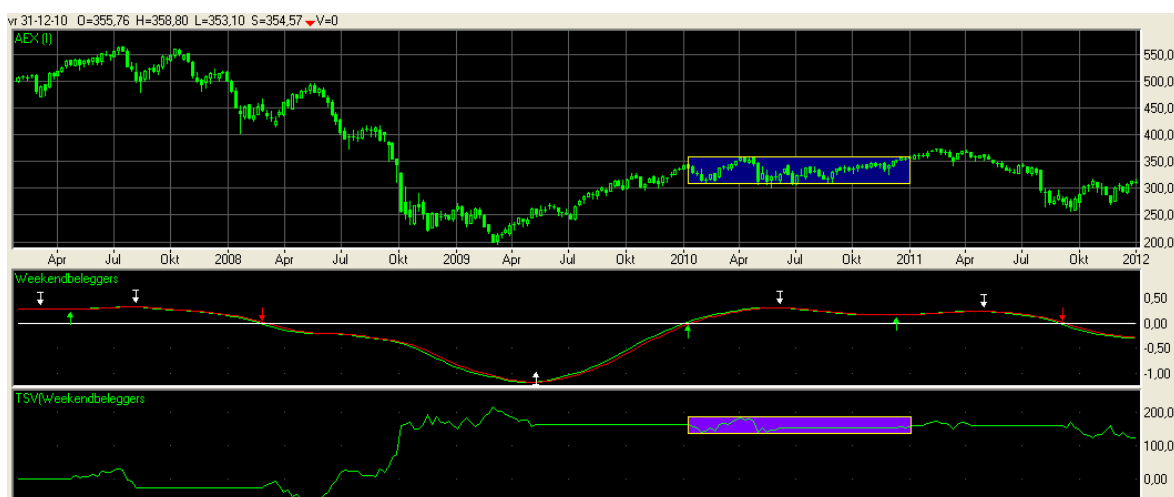
Tradingrange voor AEX in 2010 (blauwe deel) met TSV (paars)

Dit hoofdstukje over de trading range (zijwaartse beweging) is vooral bedoeld om het verschil met de strategie van stijging en daling aan te geven.