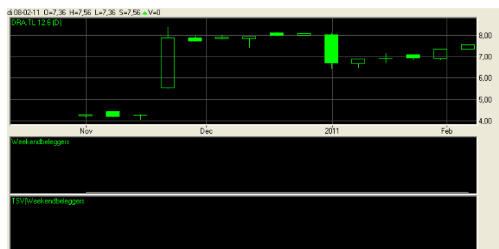
Afbeelding 2: Turbo DRAKA TL 12.6

Op 05 november 2010 gaf de WBi een open long signaal voor DRAKA (afbeelding 1). WBÉrs hebben de standaard TL 12.6 (hefboom < 4 ) aangekocht voor een prijs van 4,25. Door de uitstopping is de slotprijs bepaald op 7,56, derhalve een rendement van +77,88% (3 maanden tijd). Afbeelding (2) de afbeelding van de Turbo long (TL) 12.6.