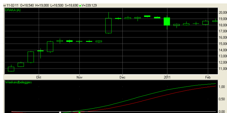
Afbeelding 1: Onderliggende waarde aandeel DRAKA

Als gevolg van het overnamebod van Prysmian S.p.A. op Draka Holding N.V. dat op 8 februari 2011 gestand werd gedaan, worden de Turbo's op Draka beëindigd. Het bod van Prysmian bedroeg EUR 8,60 in contanten plus 0,6595 nieuw uit te geven gewone aandelen Prysmian voor elk aandeel Draka. De nieuw uit te geven aandelen Prysmian worden gewaardeerd op de slotkoers van Prysmian op 7 februari 2011, EUR 15,53